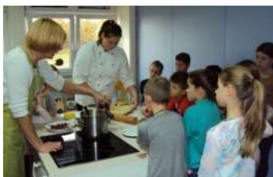
Pomagamo pri jabolčni piti