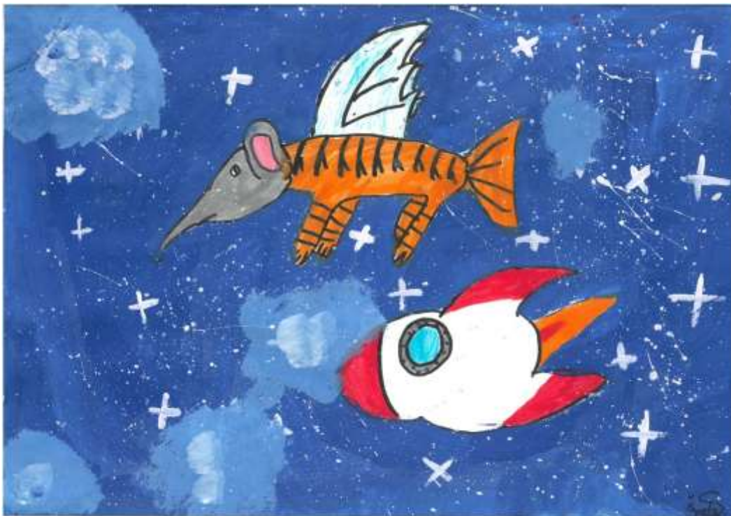
Domišljjska žival, Špela Sabadin, 5. a