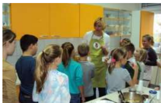
Pokušanje domačih sokov