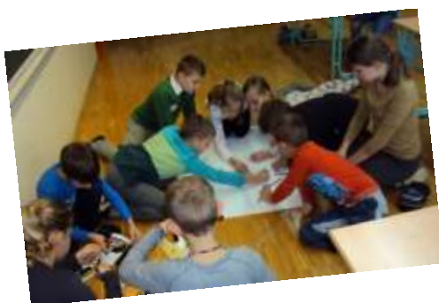
Sodelovanje pri izdelavi plakata