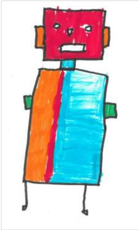
Robotek, Janže Borko, 5. a