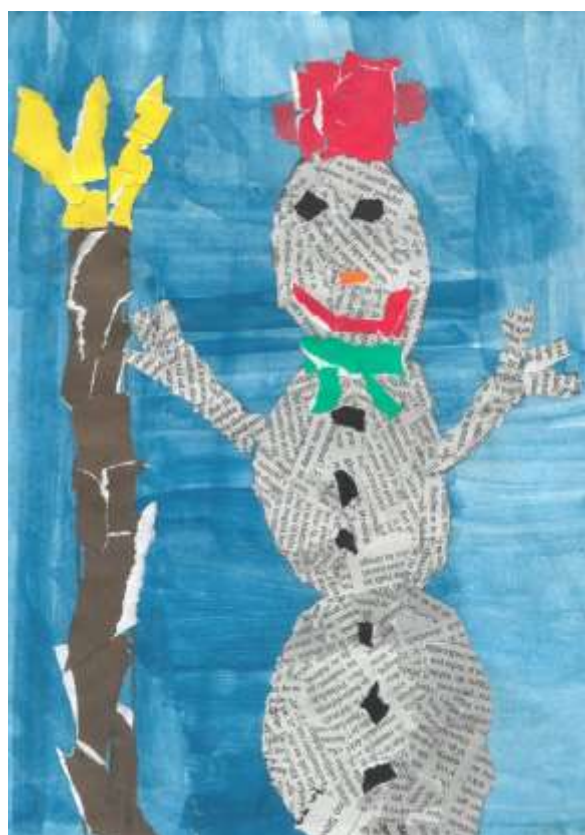
Snežak, Tisa Korenjak, 1. b