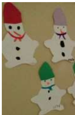
Snežaki, delo po šabloni