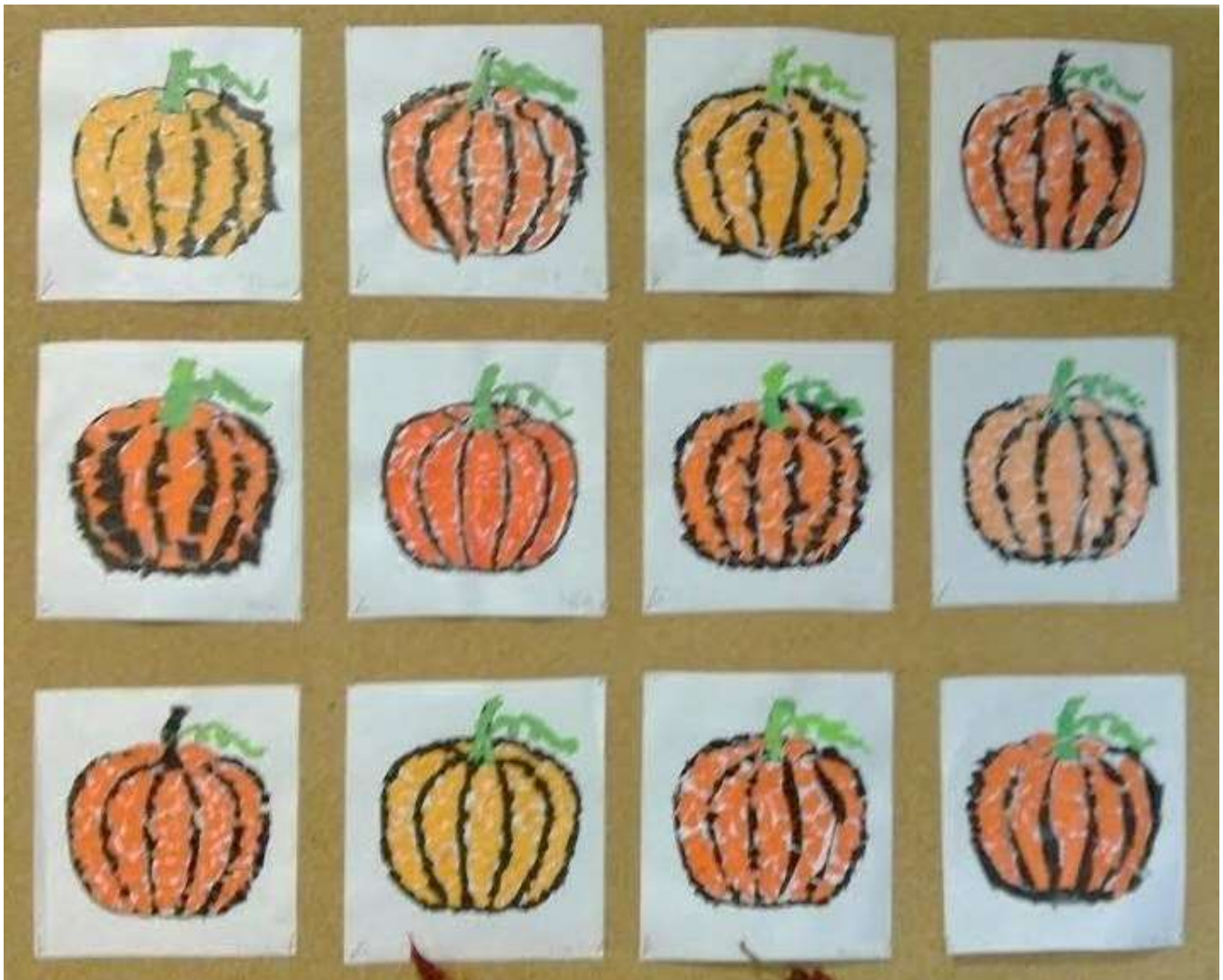
Buče, trganka, OPB 1, Vitomarci