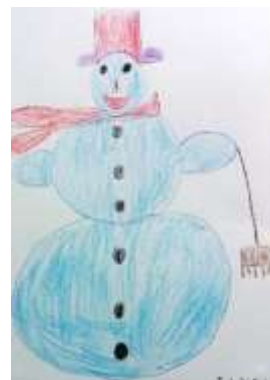
Snežak; delo z voščenkami