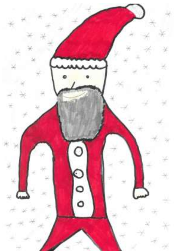
Božiček, Lan Vrbnjak, 5.a