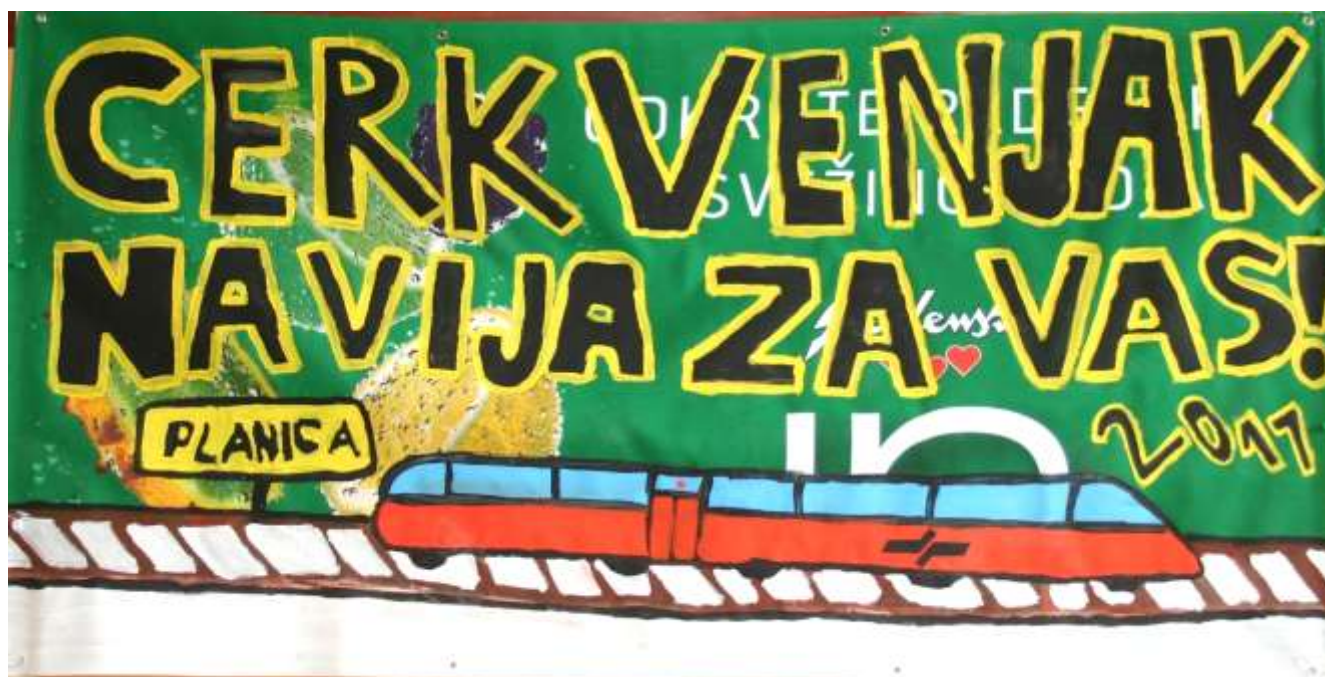
Plakat so izdelali učenci 8. razreda.