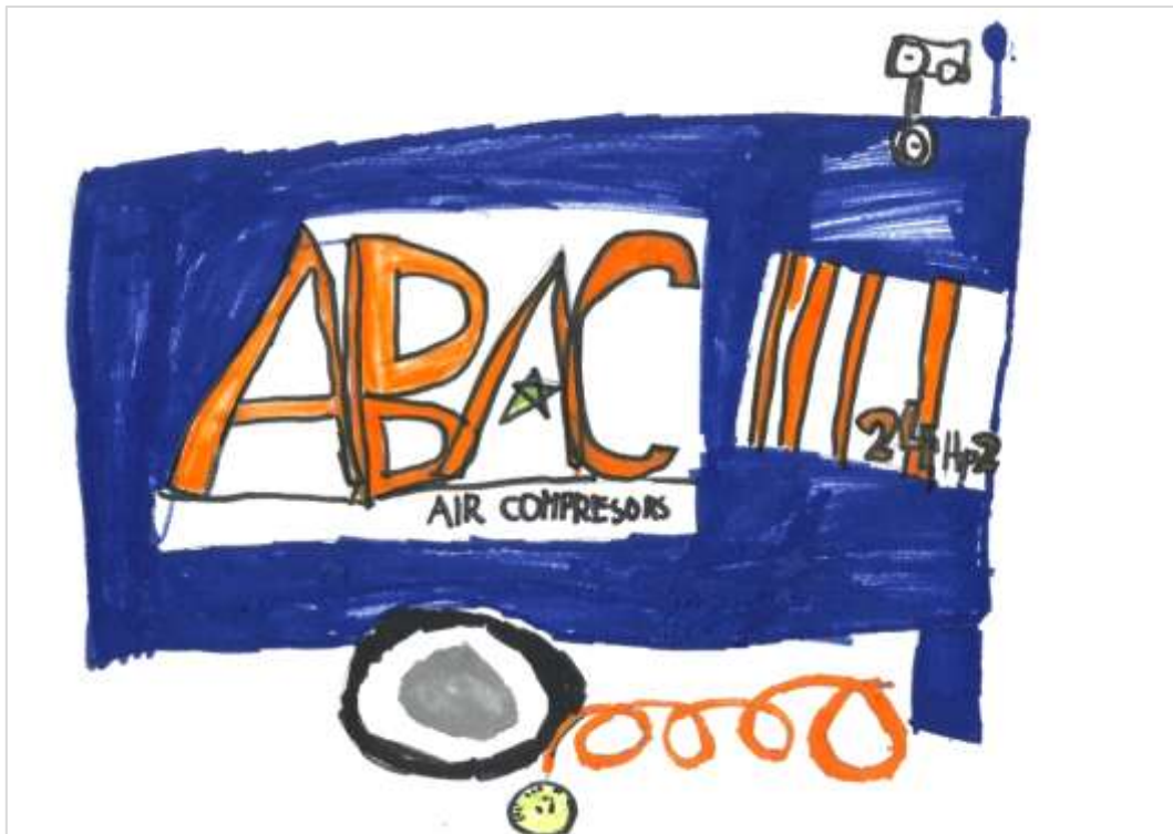
Kompresor, Jure Mulec, 5. a