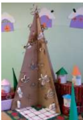
Eko smreka iz odpadnih materialov

Na (zdravje) dobro počutje otrok pozitivno vplivajo tudi sprostitvene dejavnosti. Kvalitetno preživljanje usmerjenega prostega časa razvija otrokove ročne spretnosti, likovno izražanje, domišljijo in kreativnost. Ker je ciljno zasnovano, poteka v ustvarjalno delovnem vzdušju.