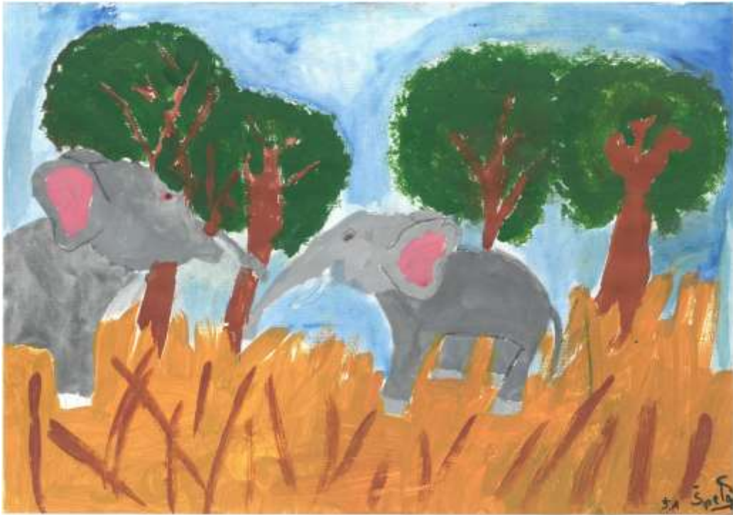
Prijateljja, Špela Sabadin, 5. a