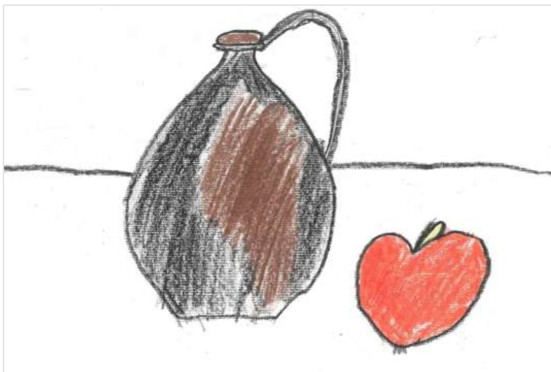
Tihožitje z jabolkom, Robi Urek, 5. a