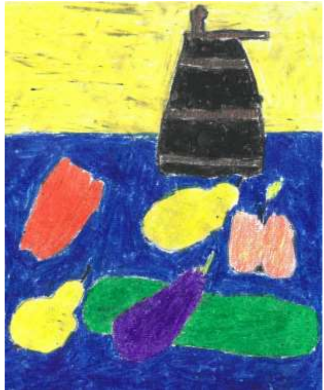
Tihožitje, Lan Vrbnjak, 5. a