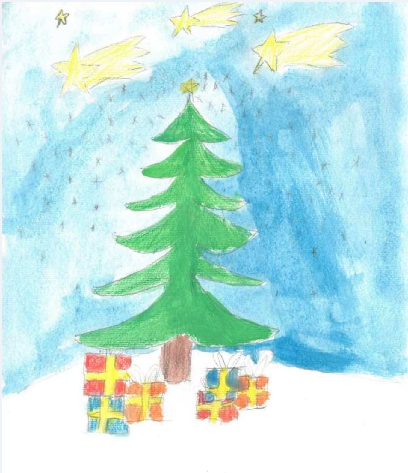
Božični čas, Robi Urek, 5. a