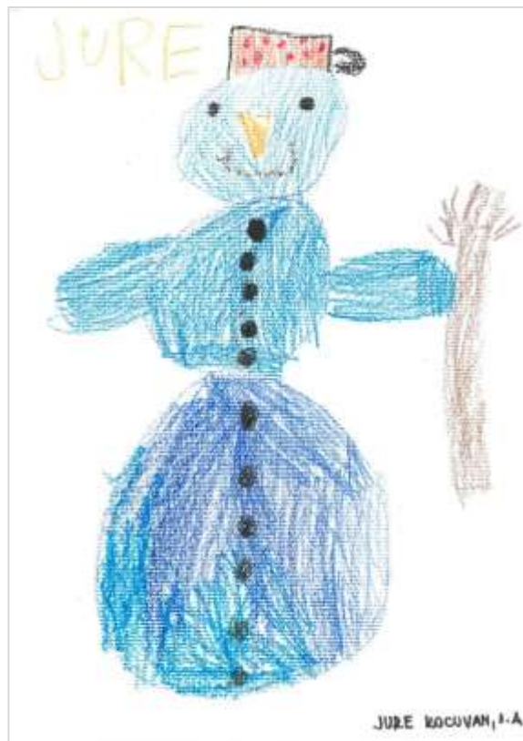
Snežak, Jure Kocuvan, 1. a