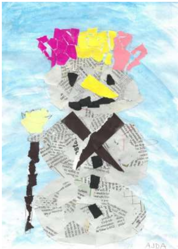
Snežak, Ajda Druzovič, 2. b