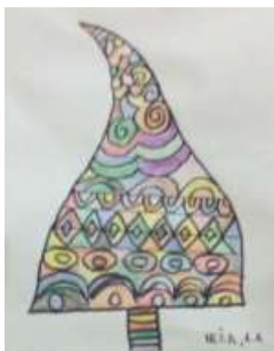
Smrečica, grafomotorične vaje