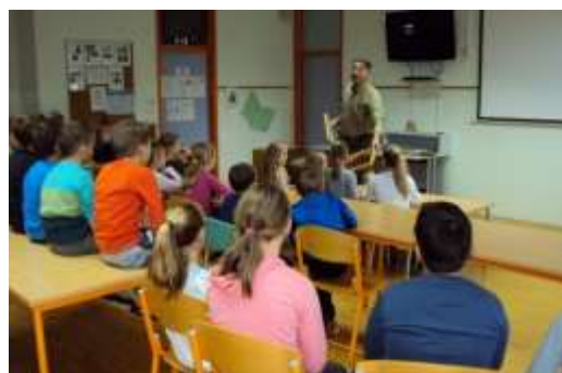
Z zanimanjem smo poslušali čebelarja