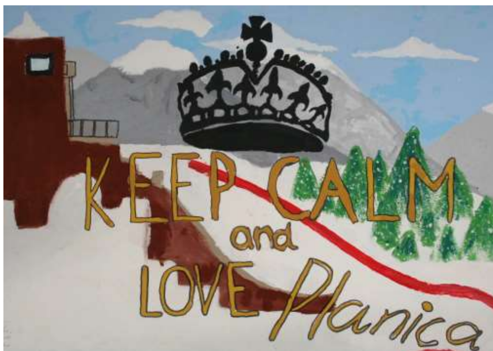
Plakat so izdelali učenci 7. razreda.