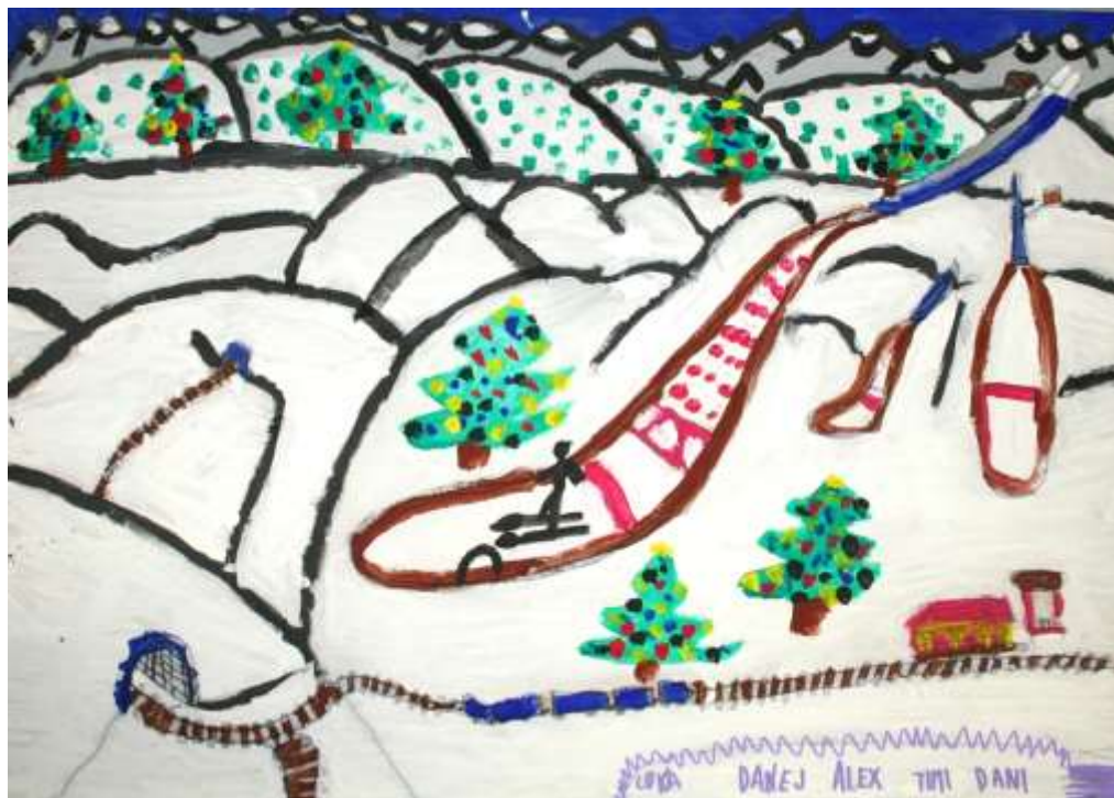
Plakat so izdelali učenci 6. razreda.